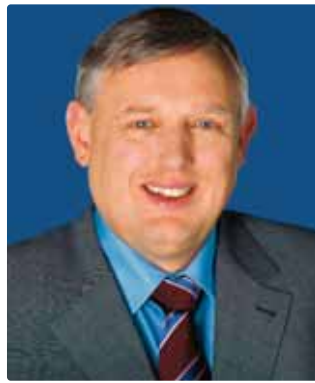
Karl-Josef Laumann , Minister für Arbeit, Gesundheit und Soziales des Landes Nordrhein-Westfalen